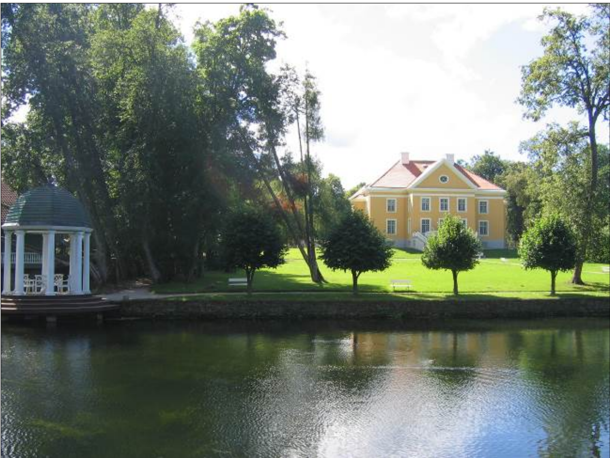
ornamentali e accolgono folaghe e cigni erano stati scavati per attività di piscicoltura. 2005 - 11 33