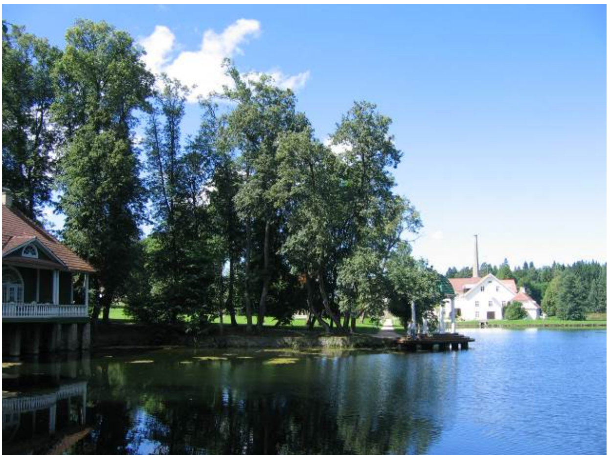
alla distilleria dal mulino a vento all'officina ed i laghetti che oggi hanno funzioni 2005 - 11