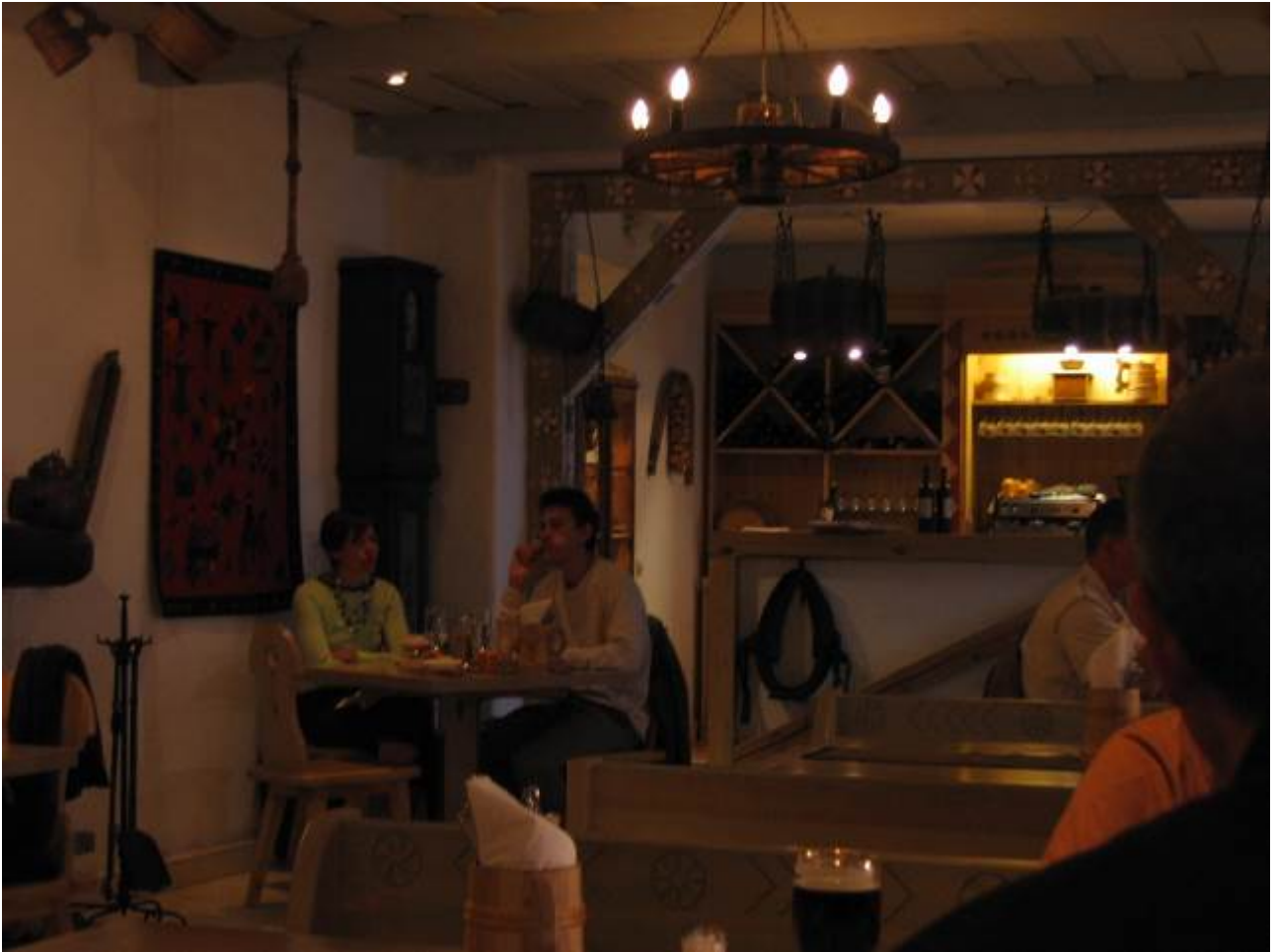
cena e ci fissano un tavolo all'Hotel St Petersburg nel ristorante estone.