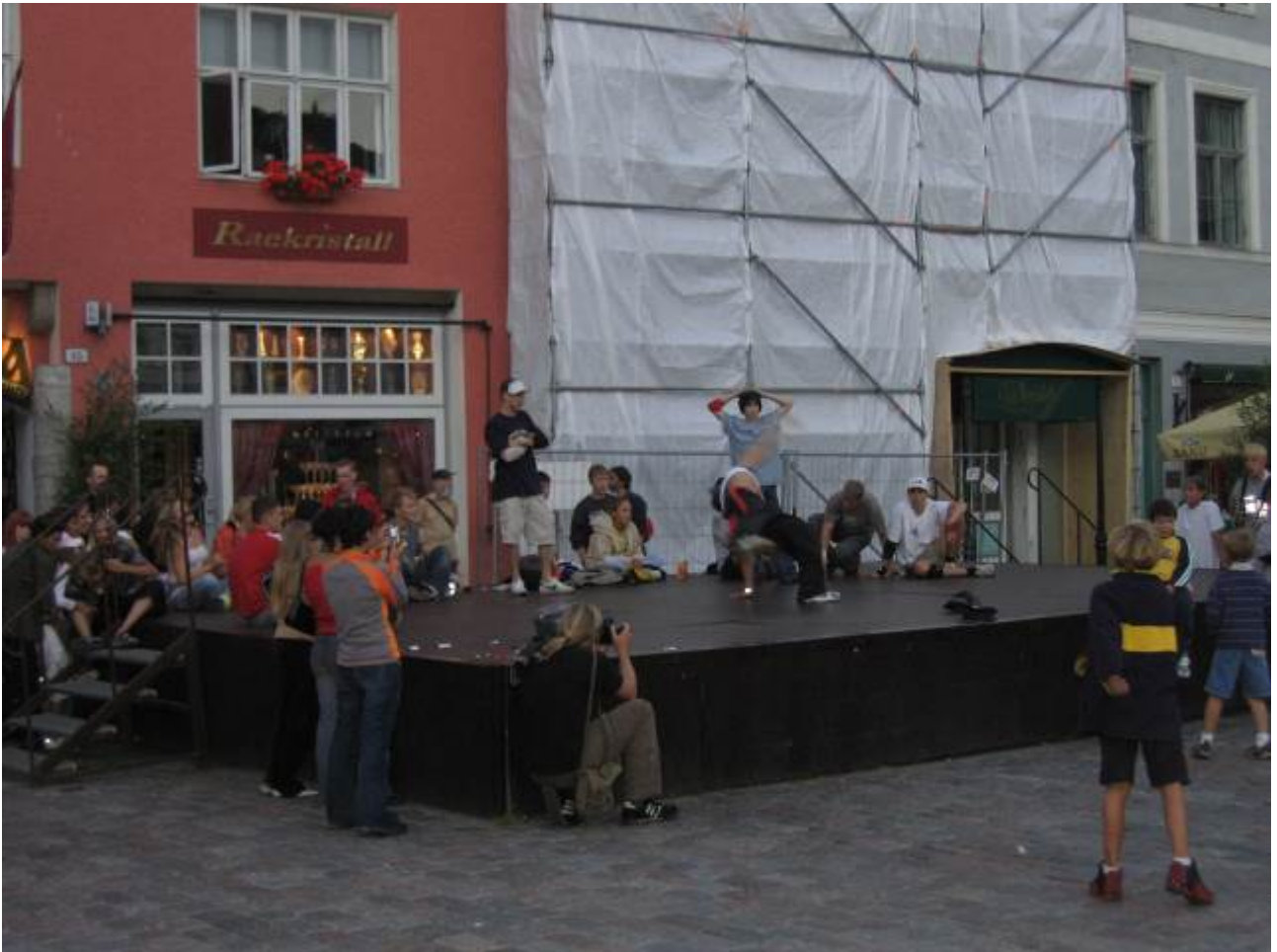
La gioventù mi sembra meno sguaiata che a Riga.